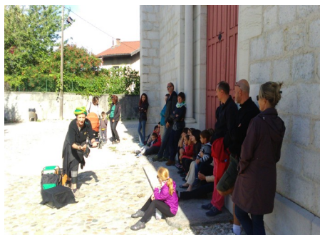
Journées du Patrimoine