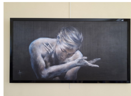
« Le Don » de Pascale Contrino