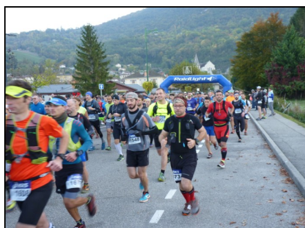
Trail du Buis