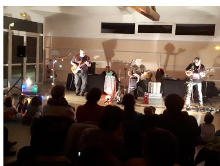
Concert rock pour les enfants