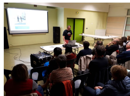
La Buisse Ciné-Passion « The Wall »