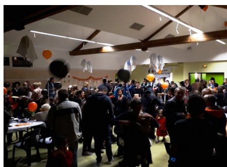
Soirée Halloween de l'A.P.E.